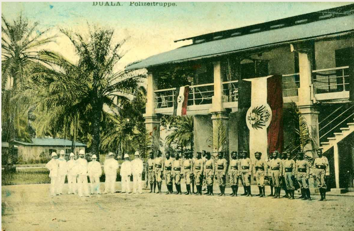
Polizeimeister und Gouverneursbeamte zusammen mit Polizeisoldaten vor dem Gouverneurspalast in Duala, Kamerun

Es handelt sich hierbei um eine erweiterte Fassung des im Deutschen Waffen-Journal 11/1992 erschienen Artikels mit Aktualisierung vom 18. Juli 2021.