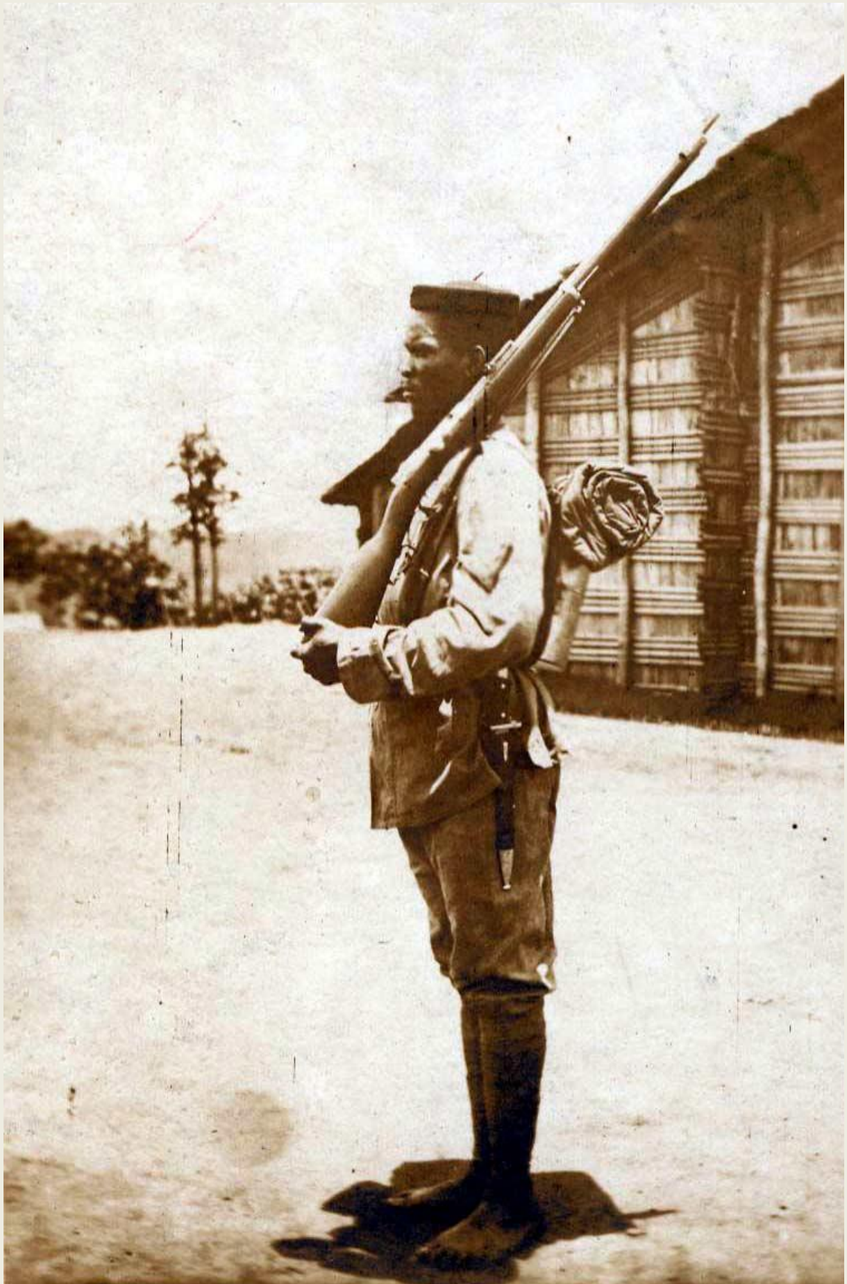
Angehöriger der Schutztruppe Kamerun